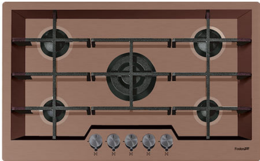
Table de cuisson KE Copper